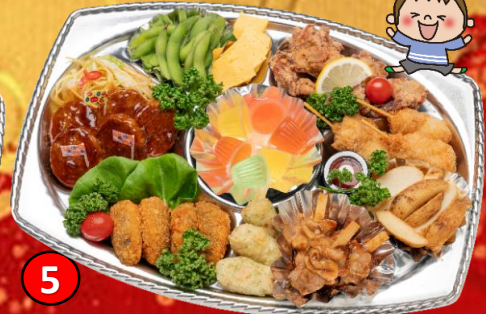
5 キッズオードブル 5,000円(税込) ハンバーグ、コロケ等、お子様が大好きな商品を盛り合わせました。