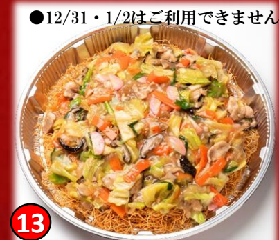
13 皿うどん 4,500円(税込) ●12/31・1/2はご利用できません。