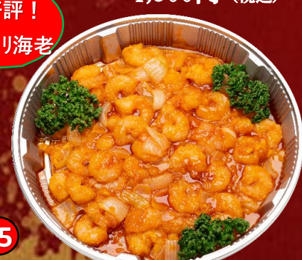
15 海老チリ盛り 6,000円(税込)