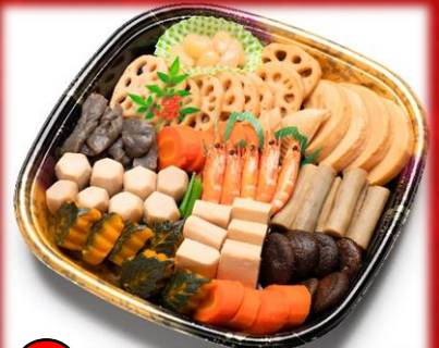
9 お煮しめ盛り 4,500円(税込) 地元の野菜を使い上品な味付けに仕上げました! ●12/31・1/2はご利用できません。