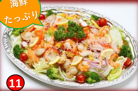
11 海鮮サラダ盛り 4,500円(税込) 新鮮たっぷり