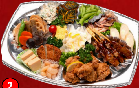
2 和風オードブル 5,000円(税込) お煮しめ、白和え、焼き鳥、唐揚げ、サラダなど12種類入った和風オードブルです。