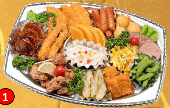
1 洋風オードブル 5,000円(税込) ハンバーグ、エビフライ、唐揚げ、サラダなど、大人気食材13種類ぎっしり詰まったオードブルです。

12/31.1/2.1/3のご予約は 12/20(水)まで 但し、なくなり次第終了