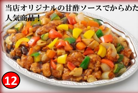
12 酢豚 6,000円(税込) 当店オリジナルの甘酢ソースでからめた人気商品!