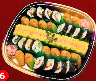
6 寿司盛り 4,500円(税込)