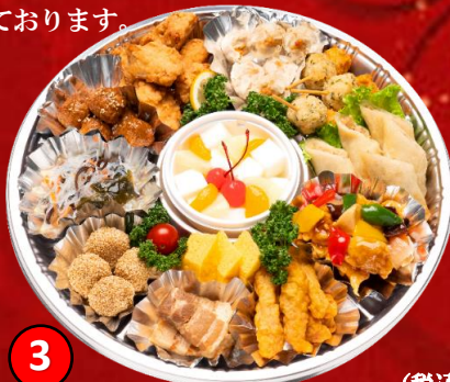
3 中華オードブル 5,000円(税込) 酢鶏、角煮、春巻き、ゴマ団子、杏仁豆腐など中華たっぷりのオードブルです。