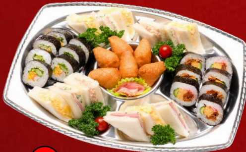
7 寿司&サンドオードブル 5,000円(税込)