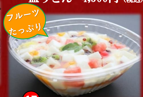
17 杏仁豆腐 4,500円(税込) フルーツたっぷり