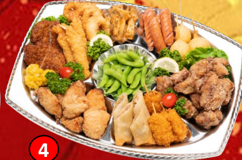
4 揚げ物盛り 5,000円(税込) みんなが大好きな揚げ物を一皿にまとめてみました。満足のオードブルです。