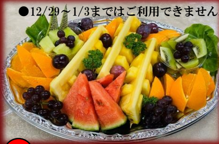
16 フルーツ盛り合わせ 4,500円(税込) ●12/29～1/3まではご利用できません。 旬のフルーツを使いますので写真はイメージになります。