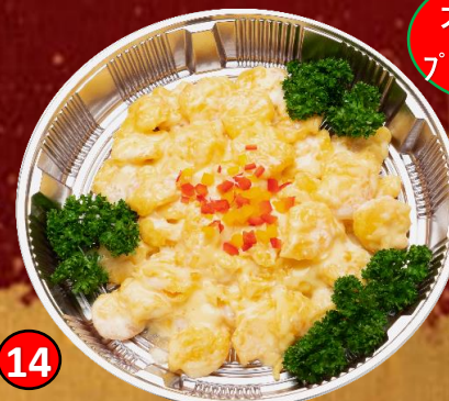
14 海老マヨ盛り 6,000円(税込) 大好評! プリプリ海老