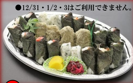
8 おにぎり盛り合わせ 4,500円(税込) ●12/31・1/2・3はご利用できません。